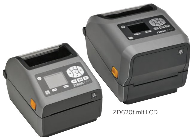
ZD620d mit LCD

Wenn Druckqualität, Produktivität, Anwendungsflexibilität und einfache Verwaltung eine hohe Priorität haben, ist der Zebra ZD620 die erste Wahl. Der ZD620, der die neue Generation der Desktopdrucker-Reihe von Zebra darstellt, löst die beliebte GX-Serie und den ZD500 ab. Mit seiner überragenden Druckqualität und hochmodernen Features bietet er weitaus mehr als herkömmliche Desktopdrucker. Der als Thermodirekt- und Thermotransfer-Modell sowie als Spezialmodell für das Gesundheitswesen erhältliche ZD620 erfüllt eine Vielzahl von Anwendungsanforderungen. Er bietet mehr Standardfunktionen als jeder andere Zebra-Desktopdrucker sowie ein optionales Bedienfeld mit zehn Tasten und LCD-Farbdisplay, das Druckereinstellung und Statusprüfung zum Kinderspiel macht. Der ZD620 nutzt Link-OS® und wird von unserer leistungsstarken Print DNA-Suite mit Anwendungen, Dienstprogrammen und Entwicklertools unterstützt, die durch bessere Performance, einfachere Fernverwaltbarkeit und unkomplizierte Integration für ein überzeugendes Druckerlebnis sorgt. Der ZD620 von Zebra bietet die Druckgeschwindigkeit, Druckqualität und Verwaltbarkeit, die Ihr Unternehmen voranbringt.