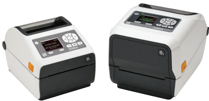
ZD620d-HC mit LCD

Als Gesundheitsdienstleister müssen Sie Ärzten und Pflegepersonal die Tools zur Verfügung stellen, die sie jeden Tag für eine optimale Gesundheitsversorgung benötigen. Der ZD620-HC von Zebra bietet mit seiner überragenden Druckqualität und hochmodernen Features weitaus mehr als herkömmliche Desktopdrucker. Der als Thermodirekt- und Thermotransfer-Modell erhältliche ZD620-HC bietet mehr Standardfunktionen als jeder andere Zebra-Desktopdrucker sowie ein optionales Bedienfeld mit zehn Tasten und LCD-Farbdisplay, das Druckereinstellung und Statusprüfung vereinfacht. Der speziell für den Einsatz im Gesundheitswesen entwickelte ZD620-HC ist desinfektionsmittelbeständig und verfügt über ein für medizinische Zwecke geeignetes Netzteil. Mit der optionalen Druckauflösung von 300 dpi werden selbst winzige Etiketten gestochen scharf und gut lesbar gedruckt. Der ZD620 nutzt Link-OS® und wird von unserer leistungsstarken Print DNA-Suite mit Anwendungen, Dienstprogrammen und Entwicklertools unterstützt, die durch bessere Performance, einfachere Fernverwaltbarkeit und unkomplizierte Integration für ein überzeugendes Druckerlebnis sorgt. Der ZD620 von Zebra bietet die Druckgeschwindigkeit, Druckqualität und Verwaltbarkeit, die Sie brauchen, um die Produktivität, Genauigkeit und Qualität bei der Pflege zu steigern.